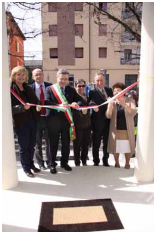
Un momento dell'inaugurazione