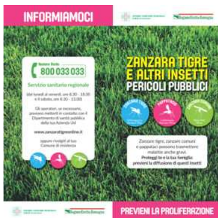
Zanzara tigre e altri insetti – Previene la proliferazione

È molto importante proteggersi dalle punture di zanzara ed evitarne la proliferazione. Si possono seguire i semplici consigli riportati nei due pieghevoli preparati dalla Regione Emilia-Romagna.