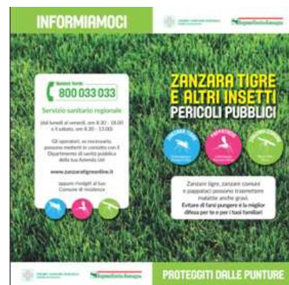
Zanzara tigre e altri insetti – Proteggi dalle punture

Per saperne di più su come scegliere e utilizzare correttamente i repellenti cutanei per zanzare è possibile consultare e scaricare il depliant realizzato in collaborazione con il CCM - Centro Controllo Malattie del Ministero della salute.