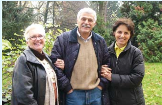
Alcuni degli infermieri volontari

L'ambulatorio dove si eseguono gratuitamente iniezioni è aperto dall'aprile del 1996. Il servizio è disponibile dal lunedì al sabato, dalle 9.30 alle 10, tranne i festivi. L'orario è però flessibile, nel senso che le iniezioni si eseguono a tutti i pazienti che si presentano entro le 10.