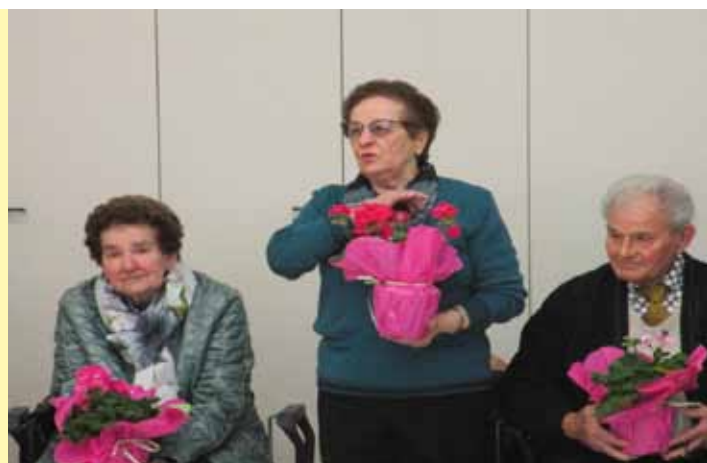
Le immagini dell'incontro tra narratori e biografi nell'Aula Magna dell'Istituto Pacinotti