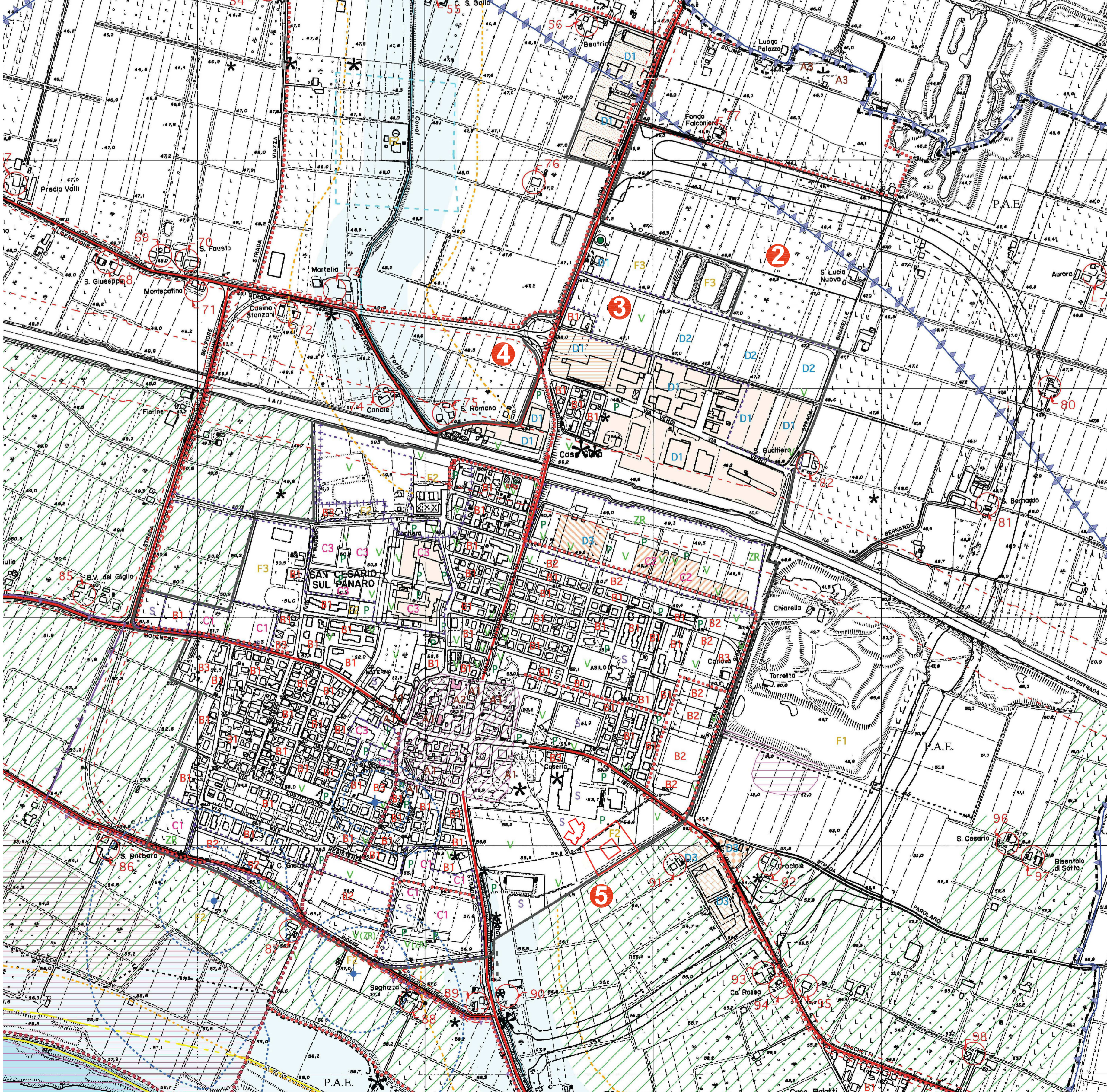
Estratto tavole 4c e 4d "AZZONAMENTO" del PRG modificato - Varianti 2,3,4 e 5 - Loc. Capoluogo