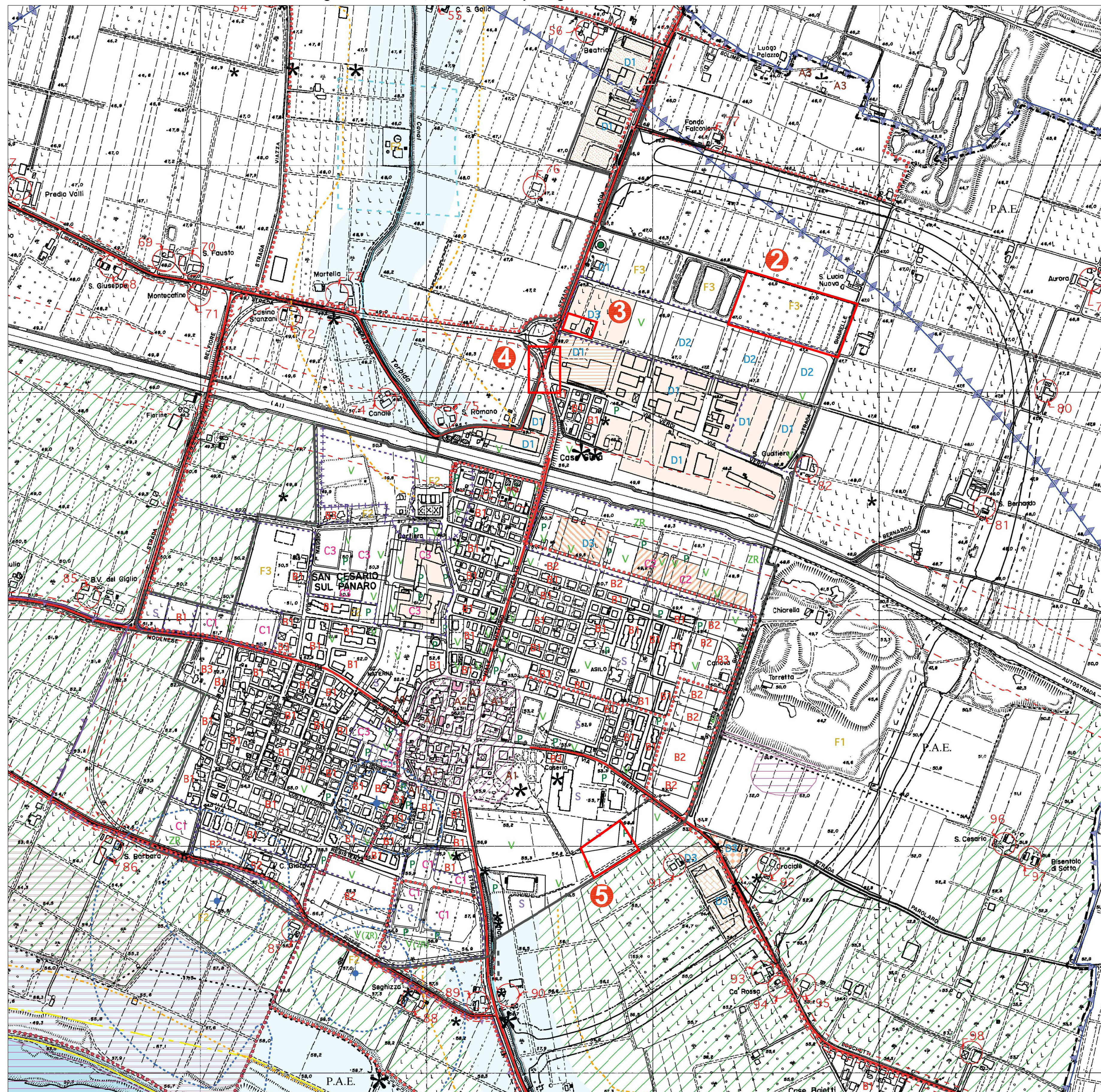
Estratto tavole 4c e 4d "AZZONAMENTO" del PRG vigente - Varianti 2,3,4 e 5 - Loc. Capoluogo

Per la Legenda si vedano le tavole di PRG vigente.