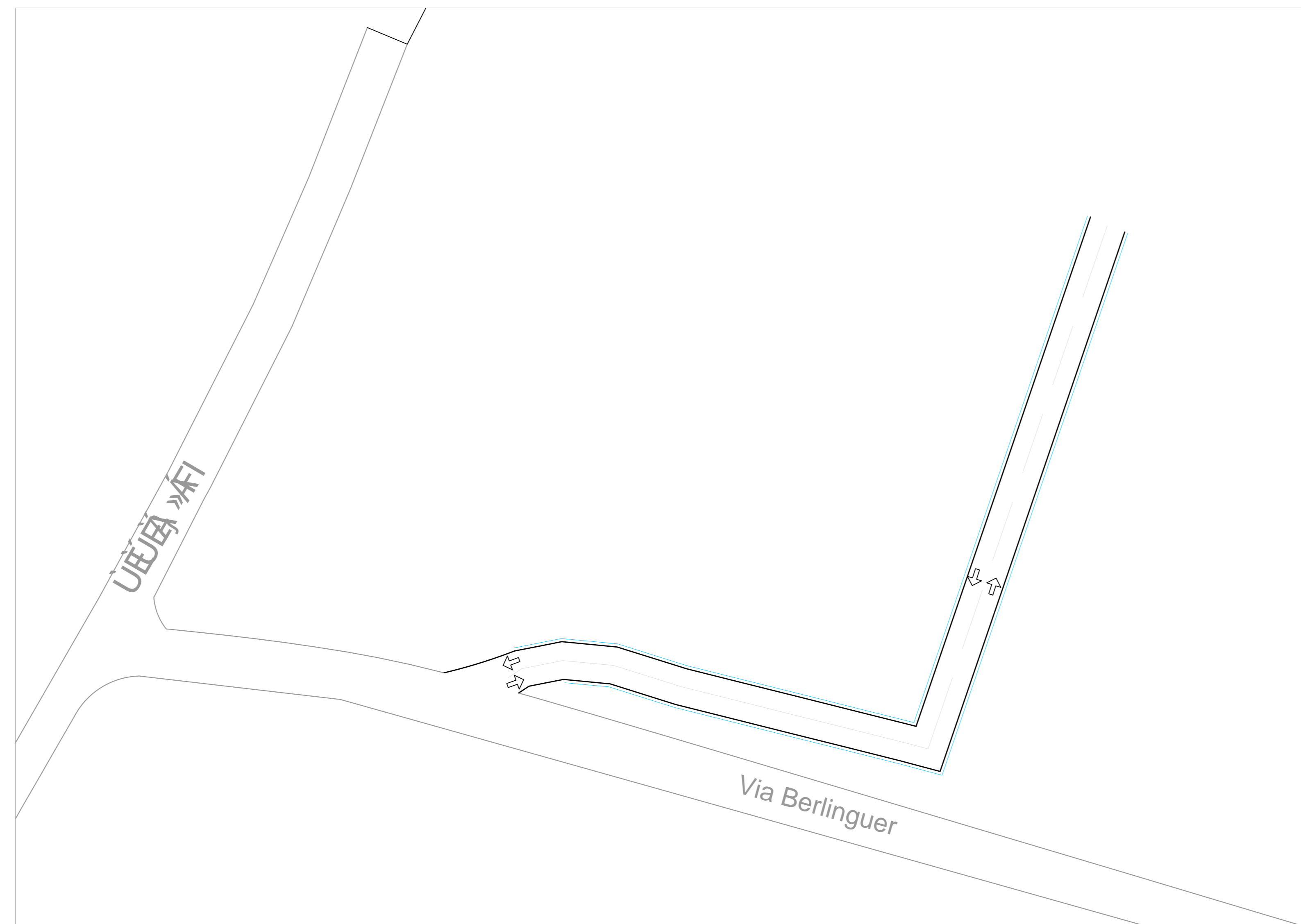
Schema dell'attestamento della viabilità temporanea di collegamento con la Via Berlinguer Scala 1:500

TRATTO C: su viabilità pubblica, Via Berlinguer - Strada Provinciale 14 - Via della Liberazione - Via Belfiore - Via Modenese - Frantoio