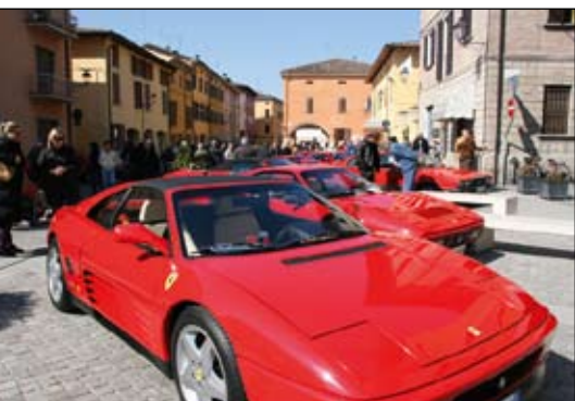
L'esposizione di Ferrari in piazza Libertà