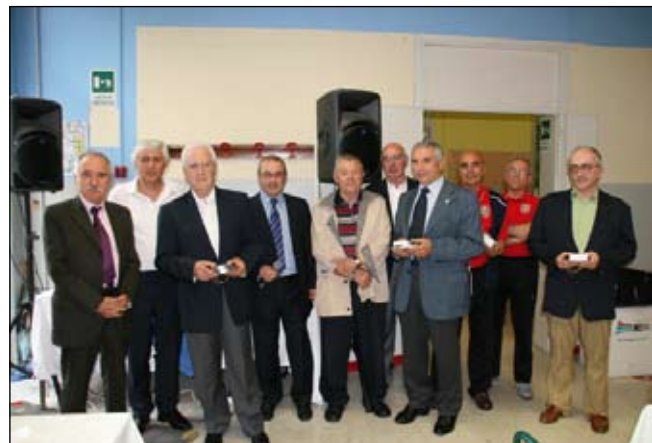
La premiazione dei soci e alcuni componenti della Società Operaia