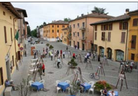
L'esposizione di antiche stampe e foto del paese in piazza Libertà

È stato un anno irripetibile sotto tanti aspetti, grazie alla collaborazione di tanti, soprattutto delle associazioni di volontariato che ci hanno dato una mano ad organizzare il nostro 150° compleanno con un vasto programma denso di significati non solo per noi, ma per tutto il paese. Da quel lontano 29 settembre 1859 (anno di fondazione ricordato dal Conte Anton Ferrante Boschetti a pag. 99 del suo testo storico San Cesario, territorio