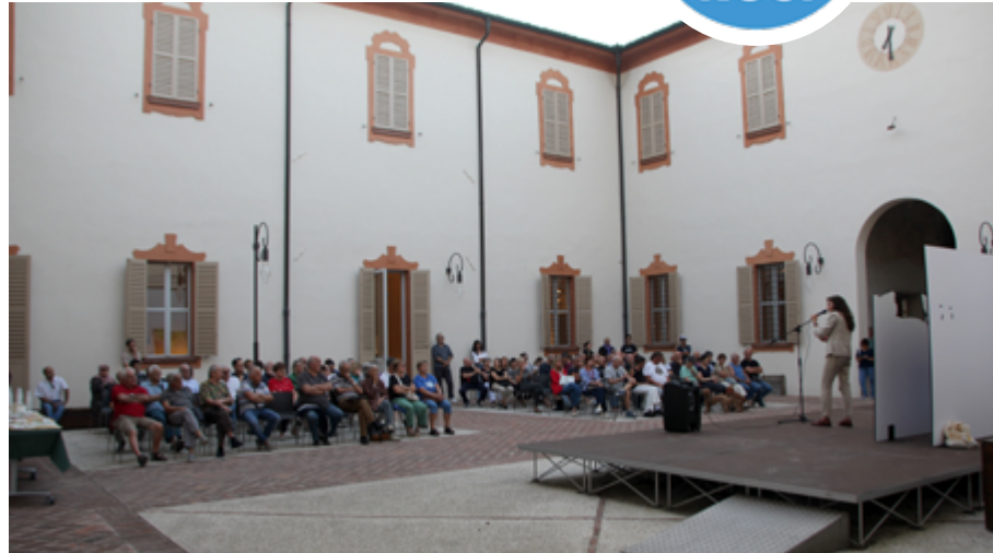
Foto: la Corte d'Onore di Villa Boschetti

L'intenzione del Comune sarebbe di massimizzare il valore intrinseco ed estrinseco del settecentesco complesso monumentale, concedendolo in gestione gratuita ad un partner selezionato, il quale a sua volta dovrà investire con mezzi propri o intercettando altri capitali pubblici o privati per riuscire a raggiungere gli obiettivi definiti dal Comune, che sono prevalentemente di natura culturale e di valorizzazione e promozione del territorio. Unendo le forze in campo per un periodo di tempo abbastanza lungo, inizialmente 10 anni, l'obiettivo dichiarato di questa operazione economica è riuscire a realizzare quello che