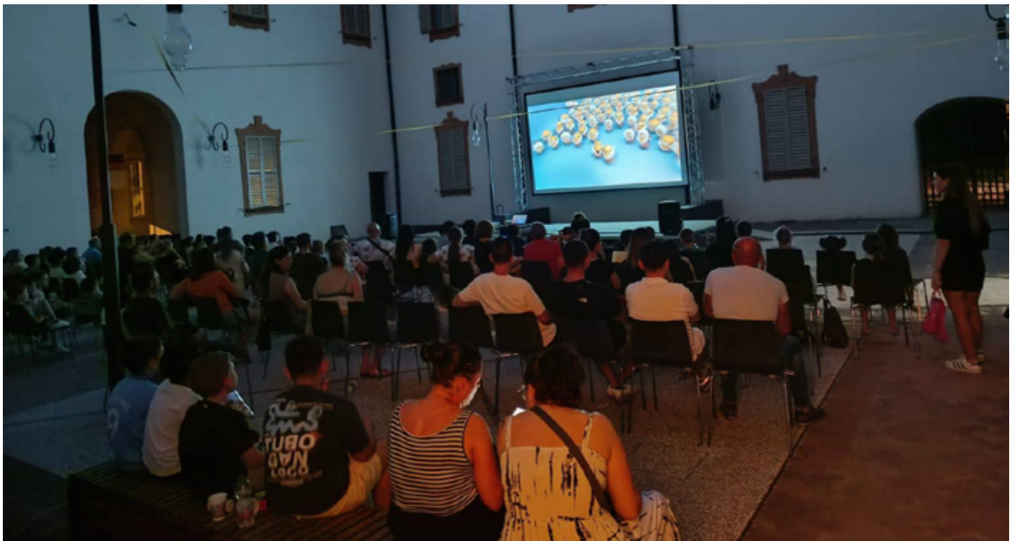
Foto: Villa Boschetti sarà il cuore degli eventi estivi