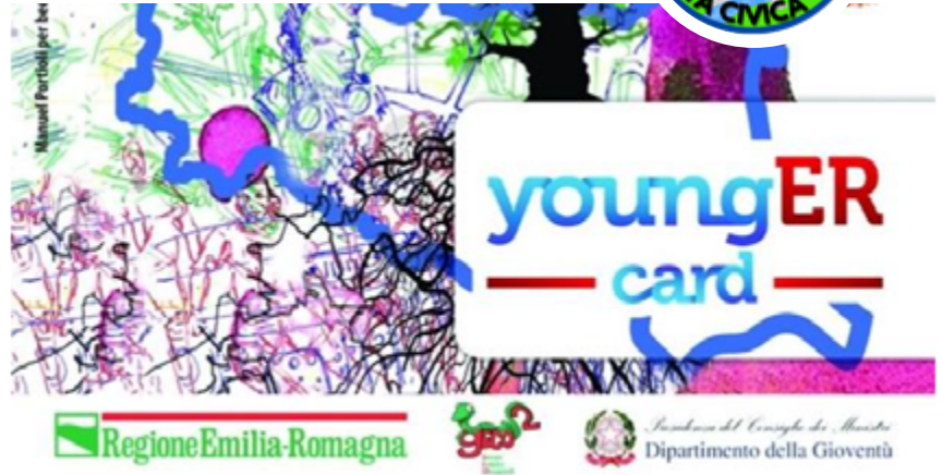
Foto: la carta gratuita dedicata ai giovani dai 14 ai 29 anni che vivono, studiano e lavorano nei territori dell'Unione del Sorbara è valida anche nel nostro paese

Ideato da "Estrarre Società Cooperativa Sociale Onlus" di Modena con l'obiettivo di "Contrastare la dispersione scolastica nei ragazzi tra 11 e 14 anni accompagnando i giovani nel percorso verso la scuola secondaria di secondo grado: non solo orientamento