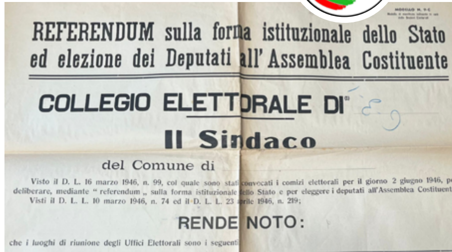
Foto: 2 giugno 1946, anche a San Cesario si vota per il referendum