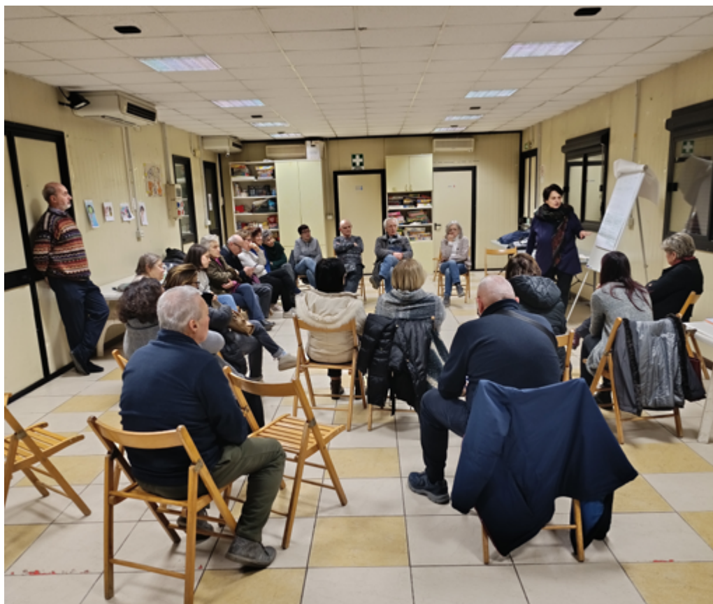
Foto: un momento di formazione dei volontari dell'Associazione

le persone in difficoltà e vogliamo che il nostro agire possa incontrare nuove volontarie e nuovi volontari con idee innovative pronti a continuare la nostra mission. Perché ciò avvenga abbiamo deciso di impegnarci in un progetto di ricerca di nuovi volontari con il supporto del Centro Servizi del Volontariato, proprio per riuscire ad intercettare quelle persone potenzialmente disponibili ma non ancora convinte di un impegno nel volontariato. Ci stiamo lavorando grazie all'impegno delle volontarie e dei volontari, ci siamo messi in gioco confrontandoci sui vari aspetti della nostra esperienza associativa: i punti di forza, le criticità, le opportunità e i timori. Da qui abbiamo provato ad immaginare Solidarietà in Rete fra 10/15 anni. Ora partiremo con il vero progetto di reclutamento.