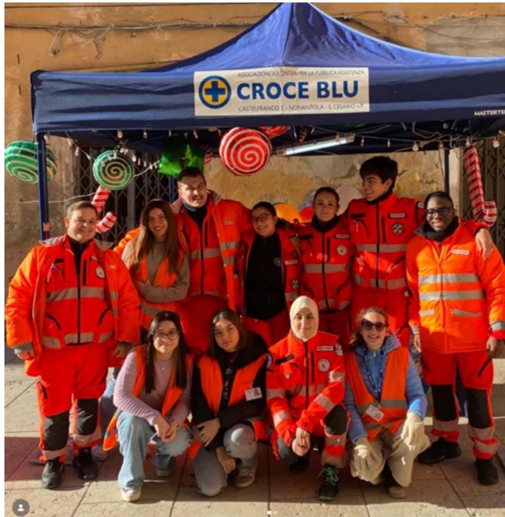
Foto: un gruppo di volontari della Croce Blu

La Croce Blu invita tutti i cittadini interessati a partecipare e a scoprire da vicino un'esperienza di volontariato che, ogni giorno, contribuisce concretamente al benessere della comunità.