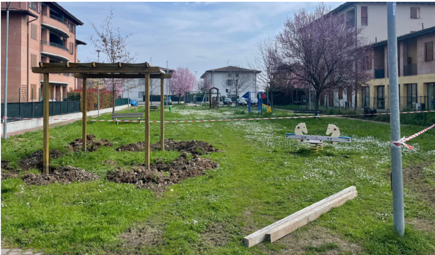
Foto: i lavori in corso ad Altolà

L'attenzione verso le frazioni è per questa Amministrazione un impegno che si traduce in interventi concreti sugli spazi di uso quotidiano. Il parco di via Pertini, a riqualificazione completata, sarà un'area più funzionale, più sicura e meglio attrezzata, in grado di rispondere in modo più efficace alla propria funzione di spazio pubblico a servizio della comunità.