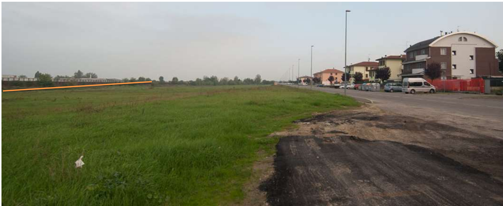
FOTO 12. Viabilità al piede dell'autostrada