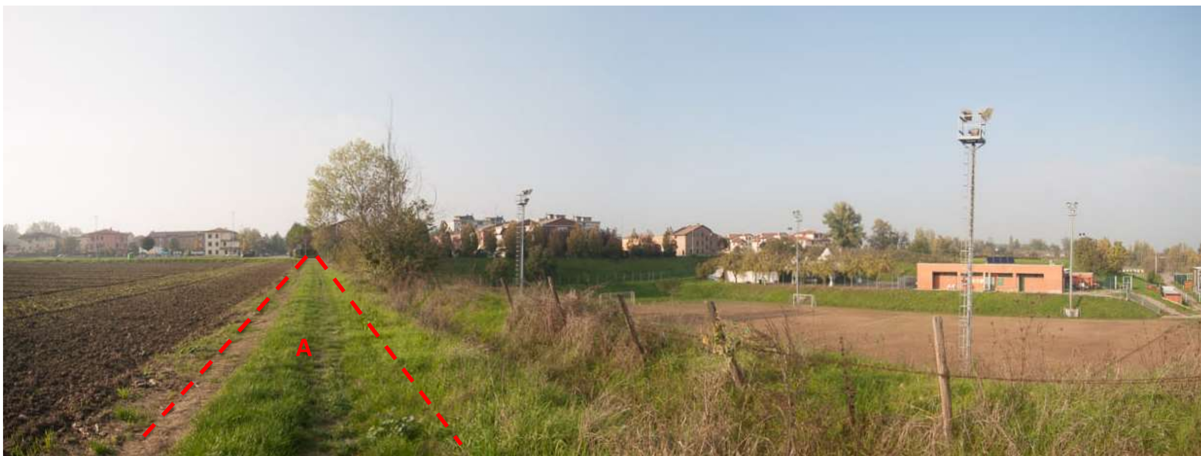
FOTO 2. Sulla destra la zona sportiva nell'area ribassata, in primo piano la viabilità dell'ipotesi A