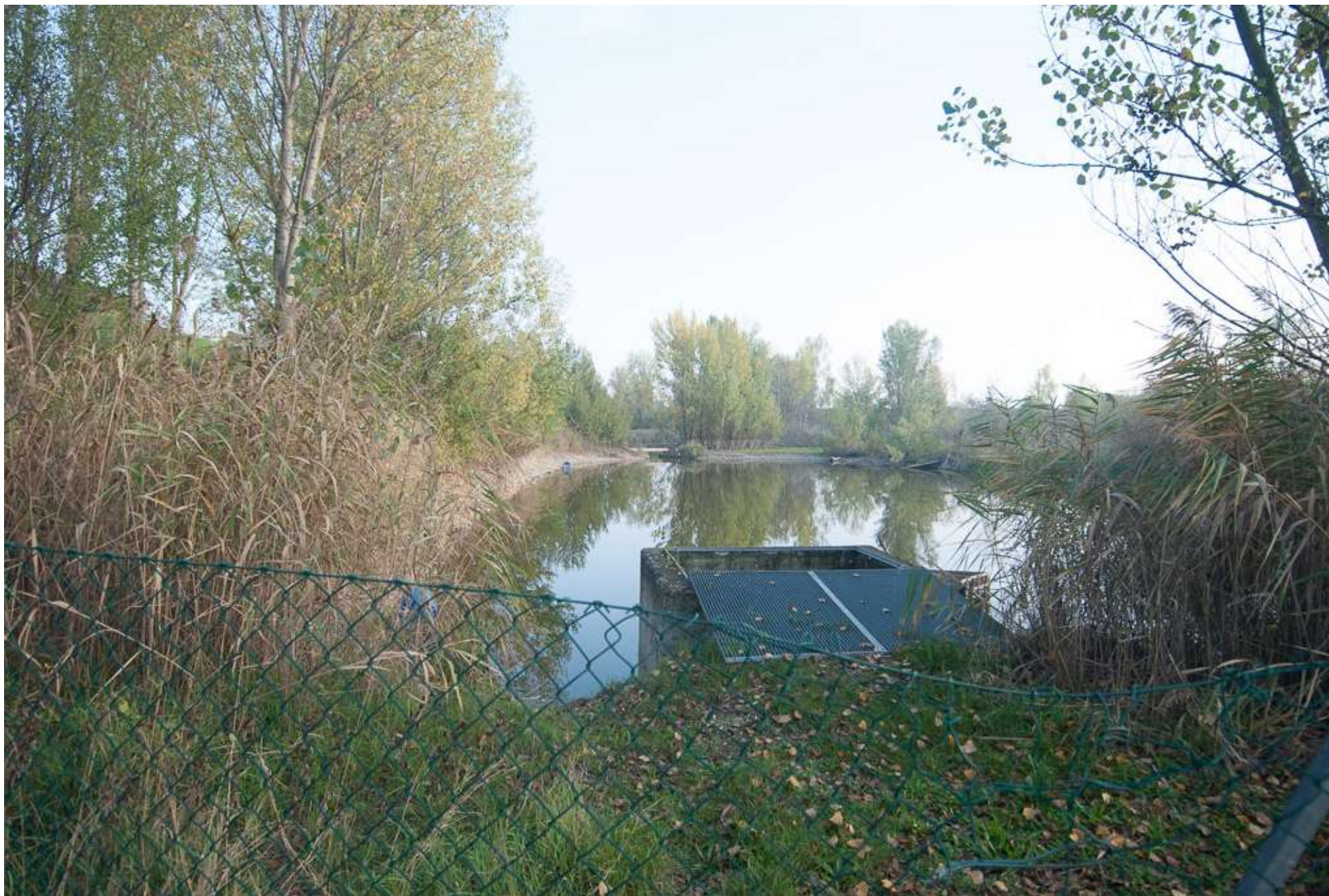
FOTO 14. Laghetto posto nella parte nord dell'area ribassata che raccoglie le acque dell'area a piano campagna ribassato.