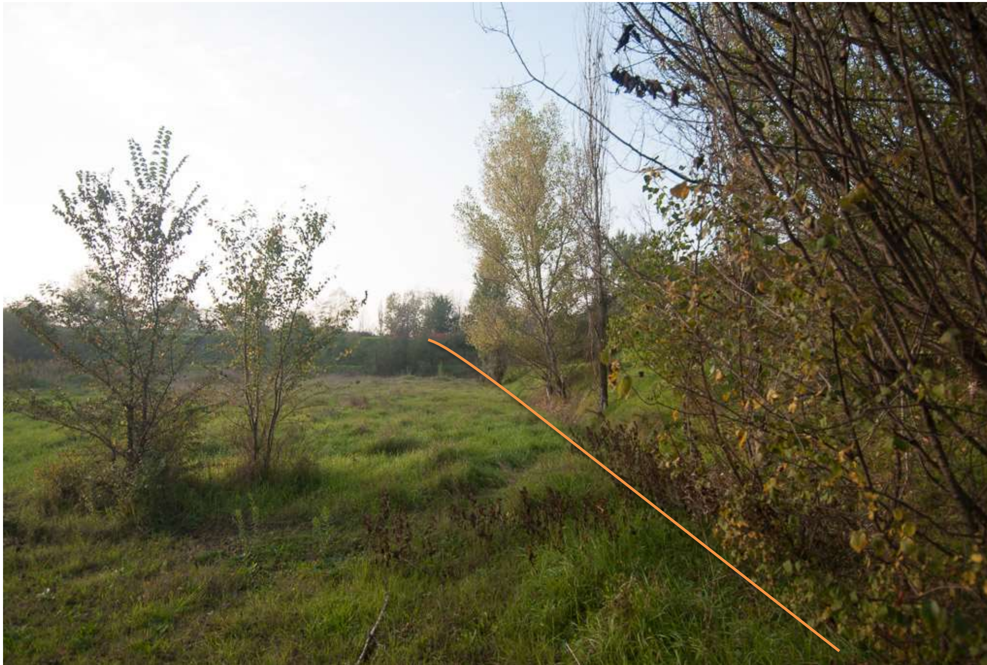
FOTO 9 Tratto di viabilità che porta fuori dall'Ambito Estrattivo Comunale