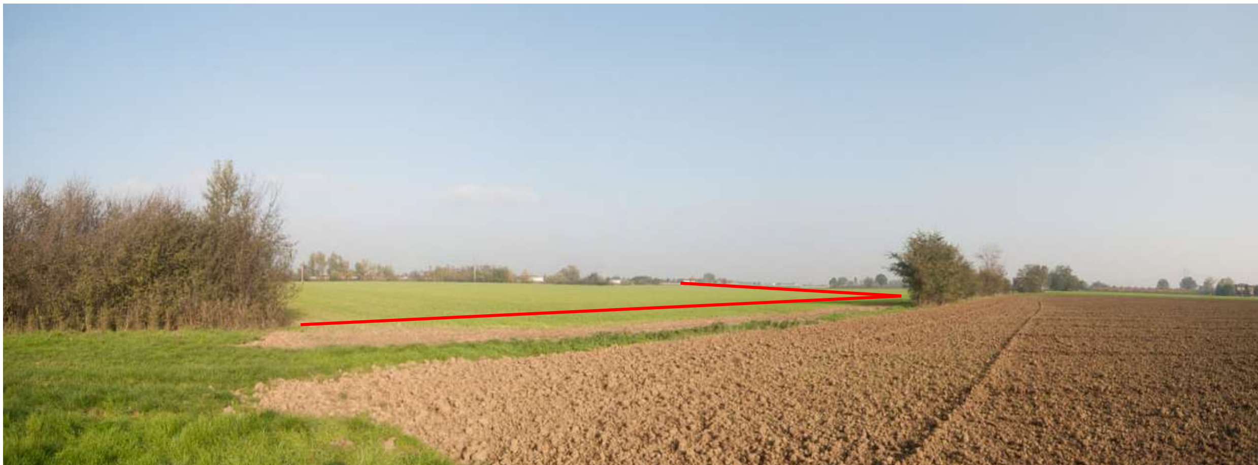
FOTO 3. Panoramica da sud-ovest dell'area di cava