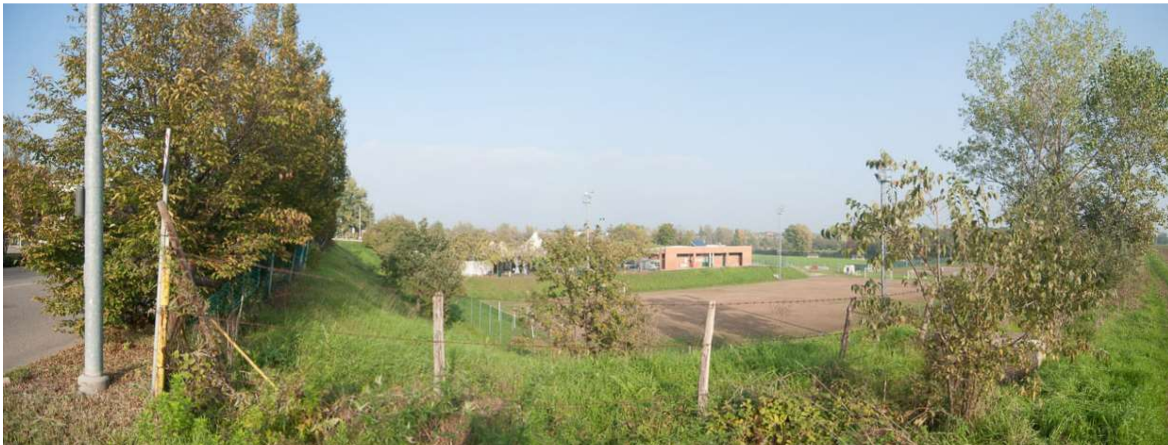
FOTO 1. Zona sportiva allestita nella ex cava Ghiarella