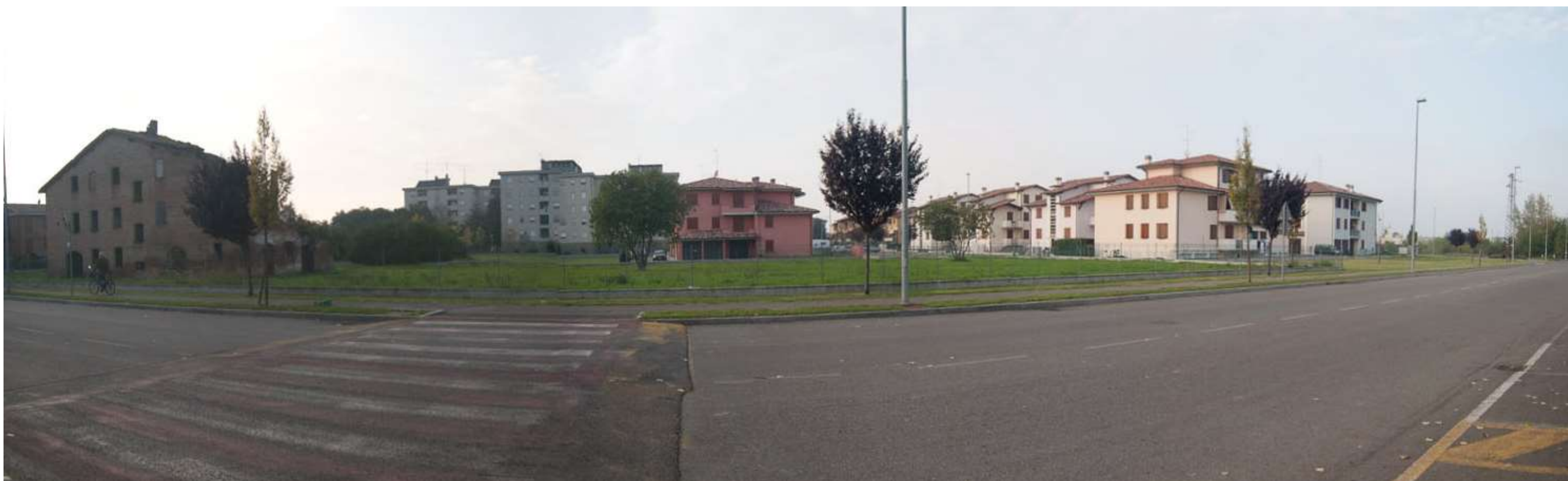
FOTO 13. L'area residenziale posta sulla Via Ghiarelle ad ovest dell'Ambito Estrattivo Comunale