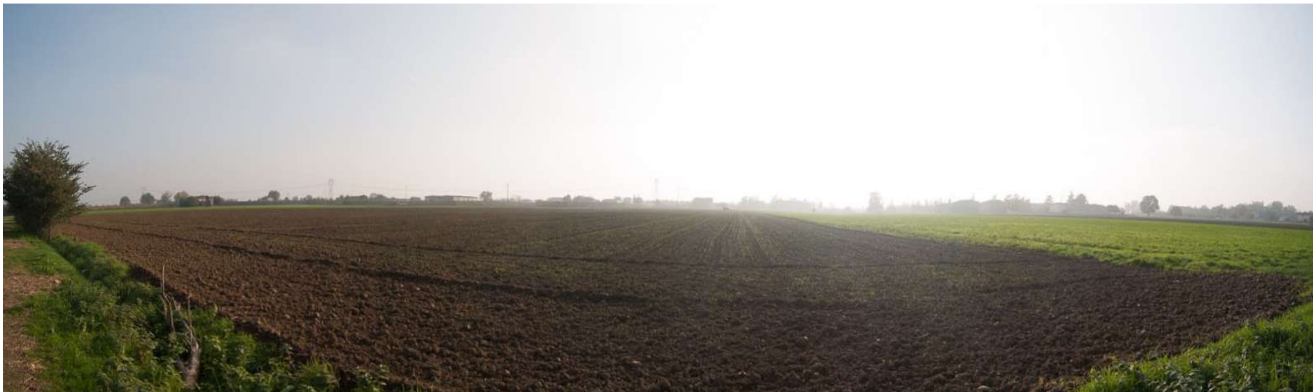
FOTO 5. Panoramica dell'area a sud della cava