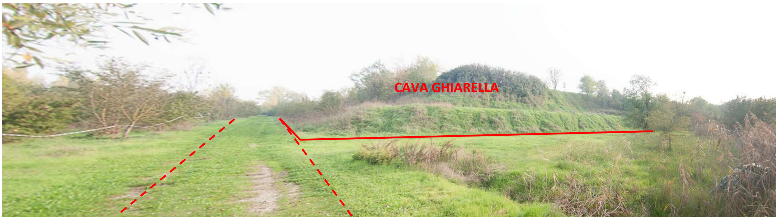
FOTO 6. Pista interna all'area ribassata che sarà utilizzata per la viabilità; sullo sfondo la scarpata che delimita il lato nord della cava Ghiarella