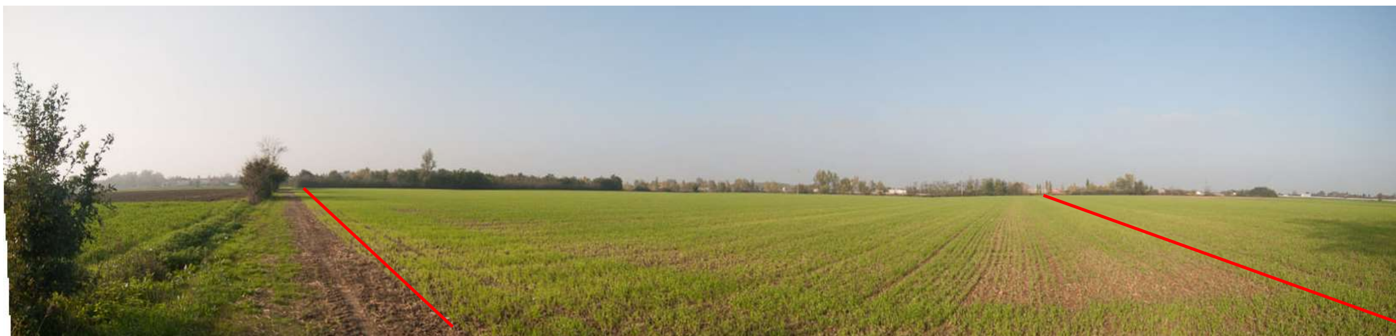
FOTO 4. Panoramica da sud-est dell'area di cava.