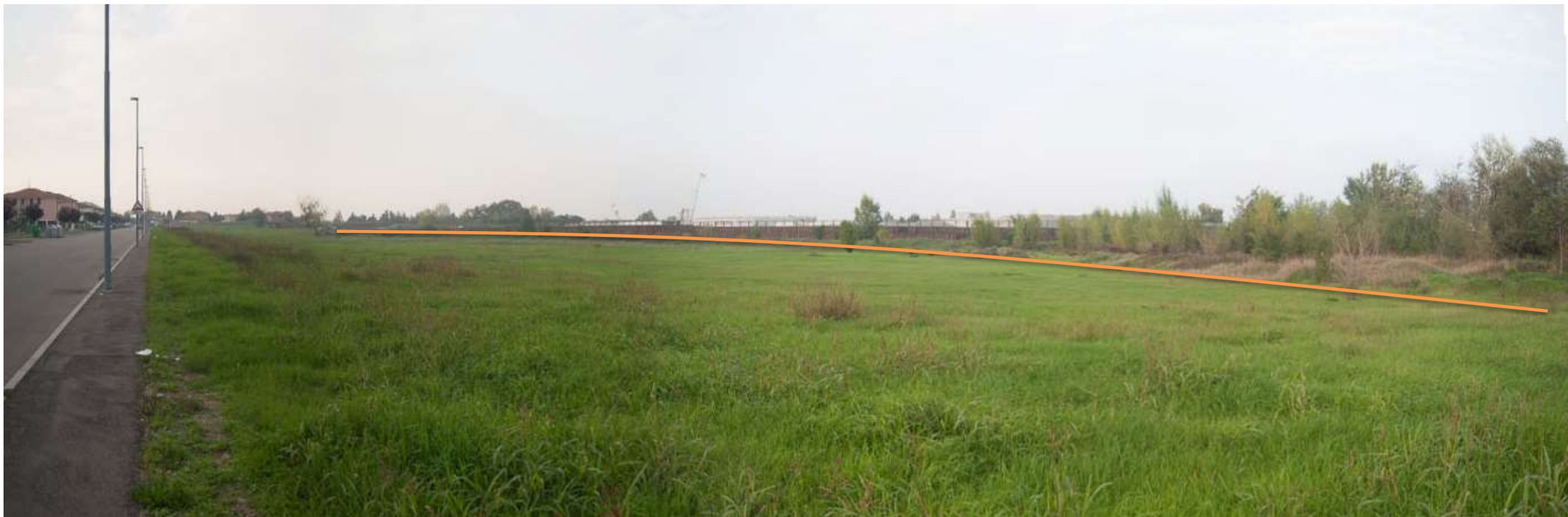
FOTO 10. Tracciato della pista che seguirà il piede dell'autostrada fino all'immissione sulla SP14