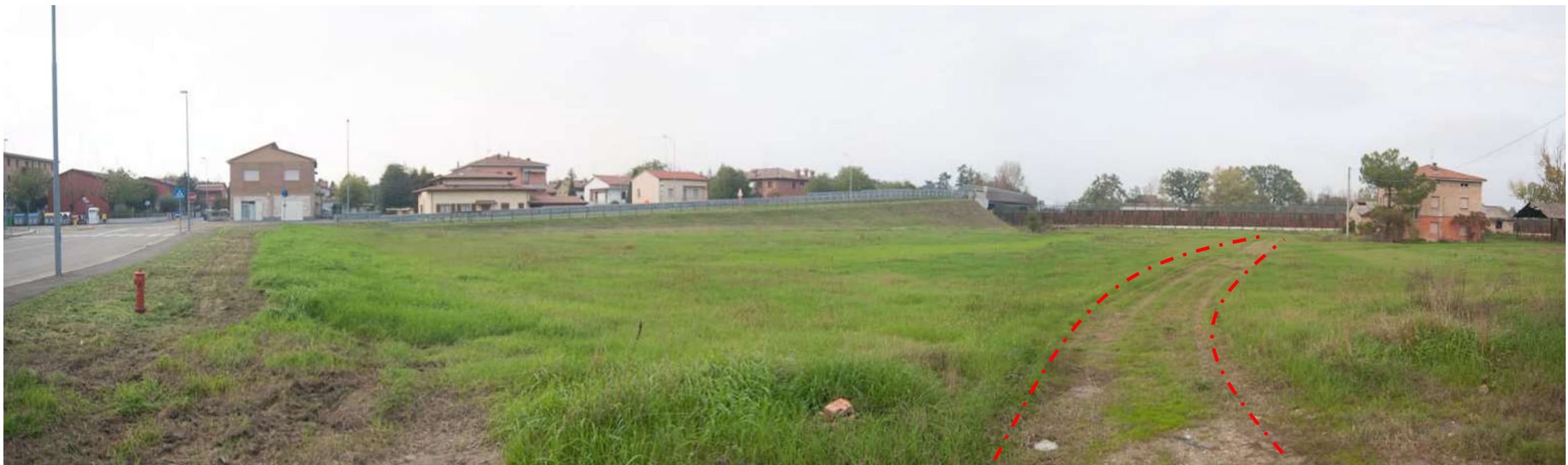
FOTO 11. Pista in uscita sulla Via Berlinguer per immettersi sulla SP14