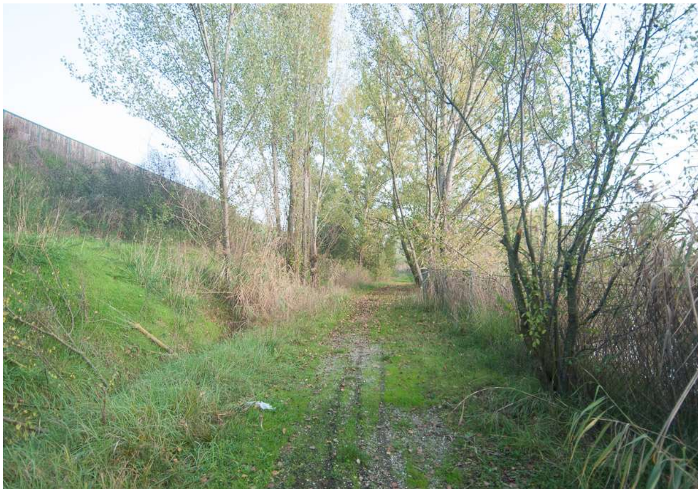
FOTO 7-8 Tratto di viabilità che costeggia il piede dell'autostrada nel tratto ribassato, a nord dello specchio d'acqua